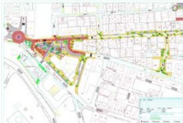
Village Phase 1A